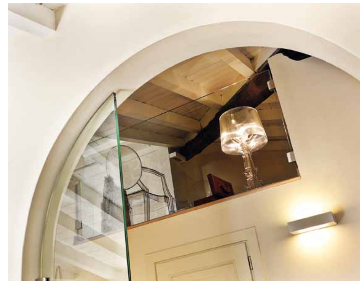
Particolari del soppalco ove è stata ricavata la zona notte completamente aperta sul soggiorno per determinare la percezione di spazialità in tutta la casa. Letto realizzato su misura, lampada piantana KTribe Flos e sedie Kartell (tutto Bussi Liviano).